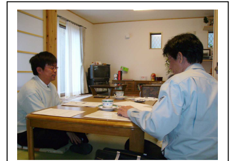
インタビューの様子です